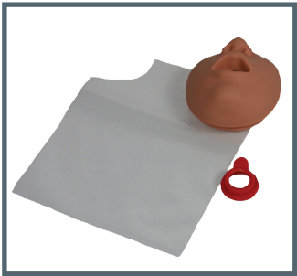
Système hygiénique Ambu